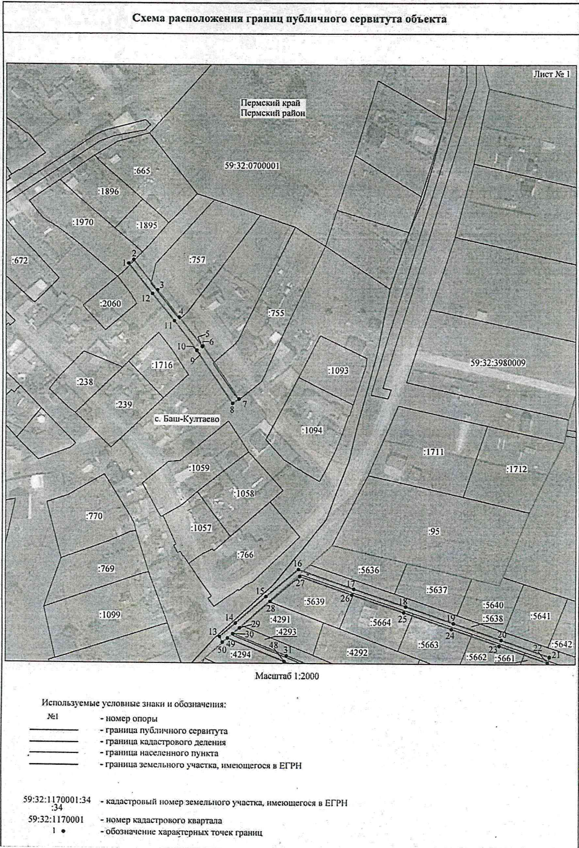
Схема расположения границ публичного сервитута объекта